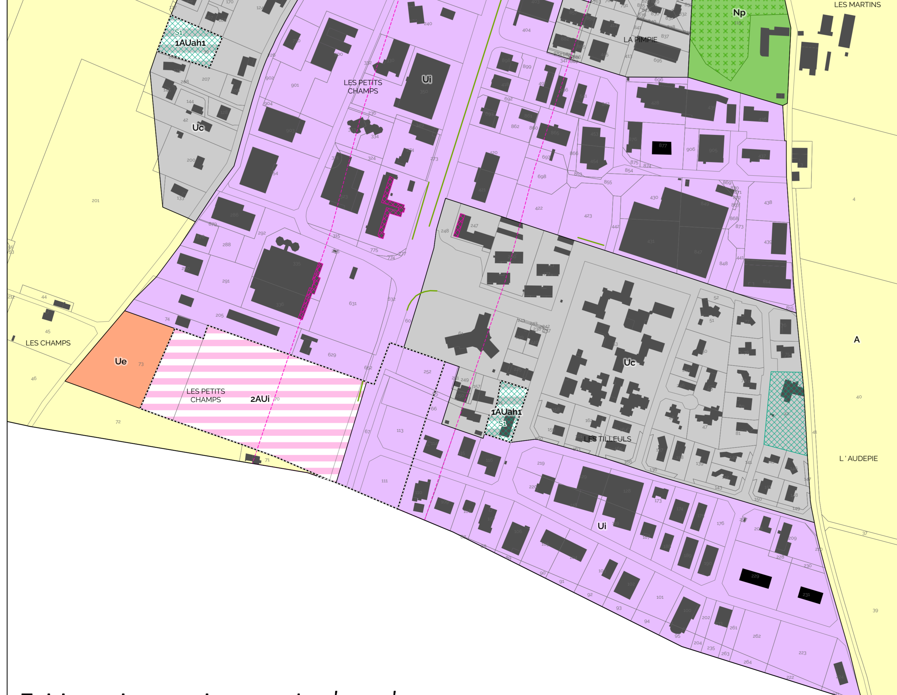
Zoom sur Fauconnières au 1/2500