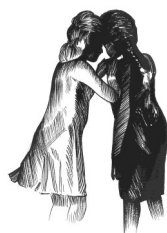
« Chuchotis », par Christian MAAS

A la création du jardin Sémaphore, les plus jeunes enfants de la commune ont été associés au développement du jardin en parrainant chacun un arbre.